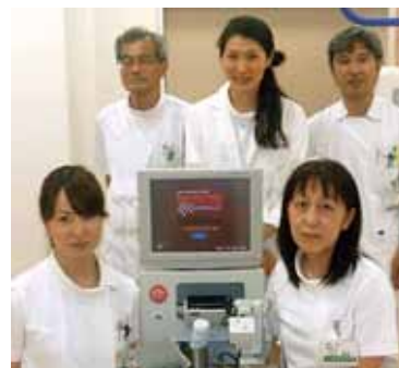
私たちが検査しています 放射線科の皆さん

血管内皮の重要性を知ってもらうために、病院ホームページへの案内掲載、および外来の受付やエレベーター内に手作りでポップを作り、ポスターを貼っています。同時に、スタッフへ呼びかけ、勉強会を開催するなどFMDを知ってもらう活動を行っています。その効果もあり、患者さんから多くの問い合わせをいただき、検査数も増えました。