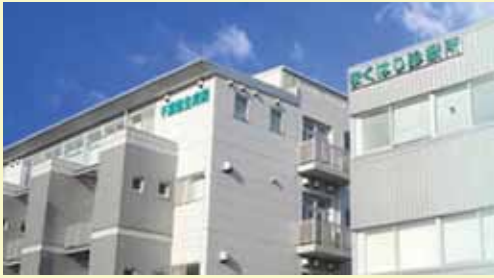
社会医療法人社団 千葉県勤労者医療協会