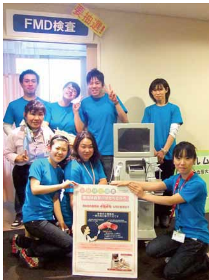
2010年5月23日 美心祭での様子

今後、予防医療を進めていくうえで、血管内皮機能を診ることは、必須な検査になると考えています。